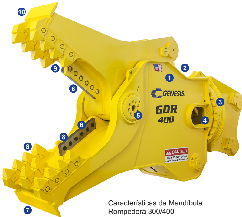
Características da Mandíbula Rompedora 300/400